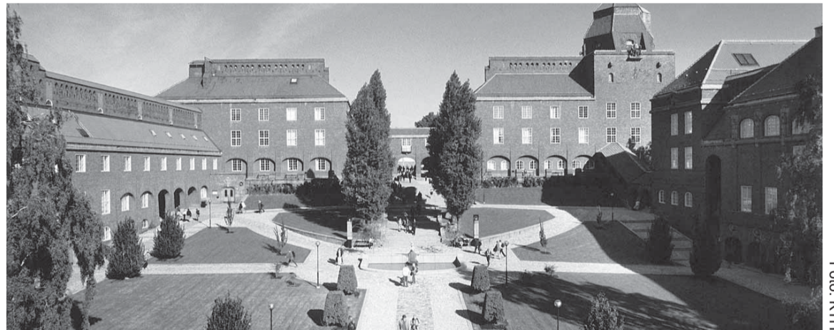
SKC är ett svenskt nationellt forskningscentrum förlagt till Kungliga Tekniska högskolan i Stockholm.