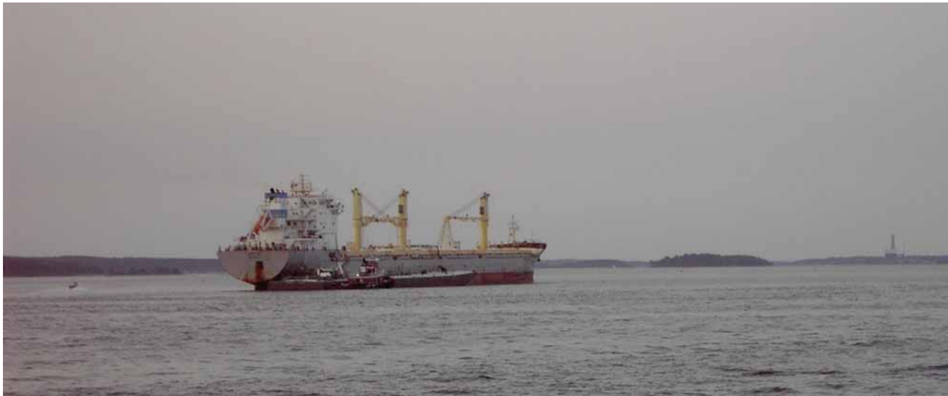
Oljetanker. Peak oil och peak gas var utgångspunkten för sessionen "Hur öka BNP inför hotet om minskad transportverksamhet?"