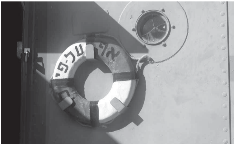
"Livbojen" är den betäckning Svenskt Kärntekniskt Centrum har fått inom kärnkraftsbranschen.